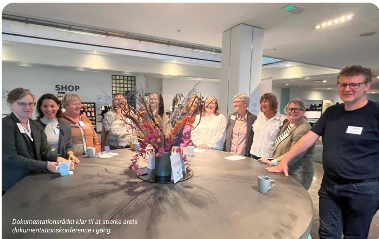
Dokumentationsrådet klar til at sparke årets dokumentationskonference i gang.

Efter konferencen har sygeplejersker udtalt, at det var en spændende dag, hvor de gik hjem med inspiration, fornyet energi og en glæde ved at være sygeplejerske. Andre blev på en dag som denne mindet om, hvorfor de